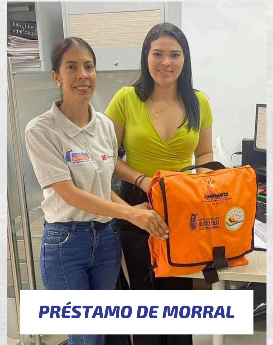
PRÉSTAMO DE MORRAL