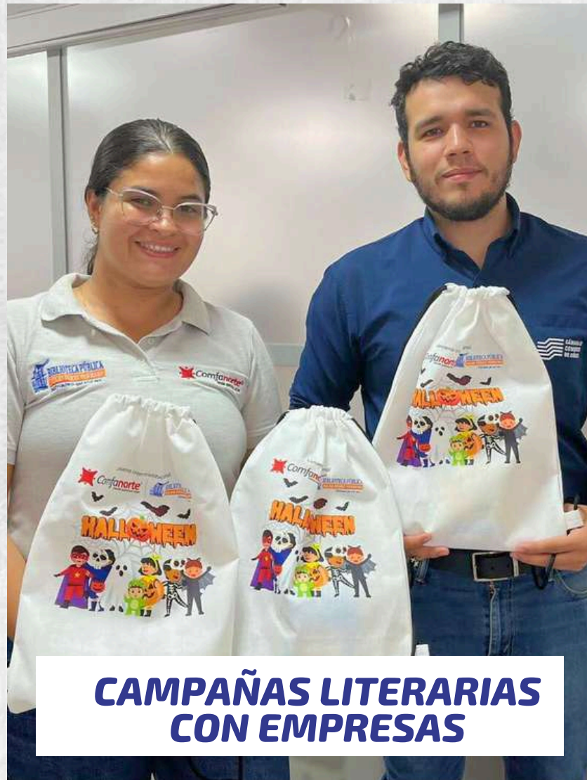
CAMPAÑAS LITERARIAS CON EMPRESAS