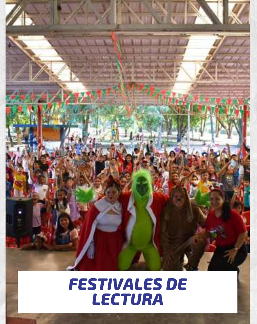
FESTIVALES DE LECTURA