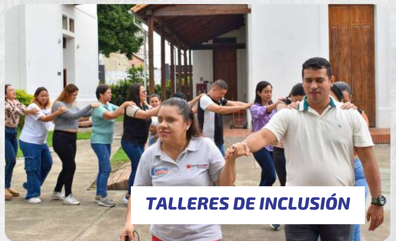
TALLERES DE INCLUSIÓN